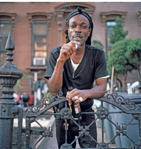
PERSONAL TIES