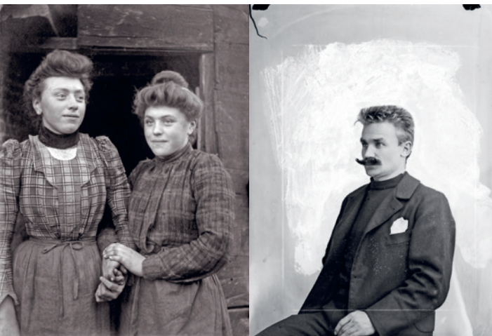
FOTOGRAFISCH WERK – STIJN STREUVELS © COLLECTIE STAD ANTWERPEN, LETTERENHUIS – COLLECTIE VLAAMSE GEMEENSCHAP