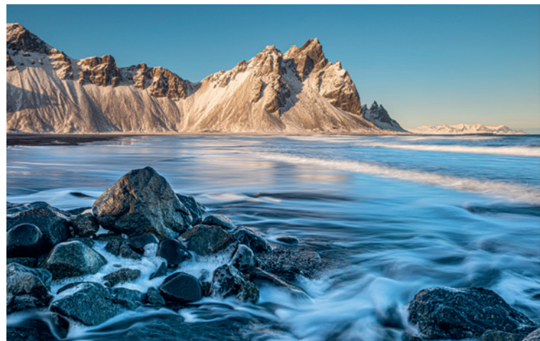
IJSLANDSE PARELS