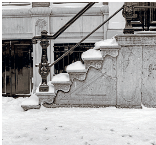
WINTER IN AMSTERDAM