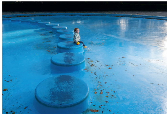
DE GEMENE DELER © LOET KOREMAN